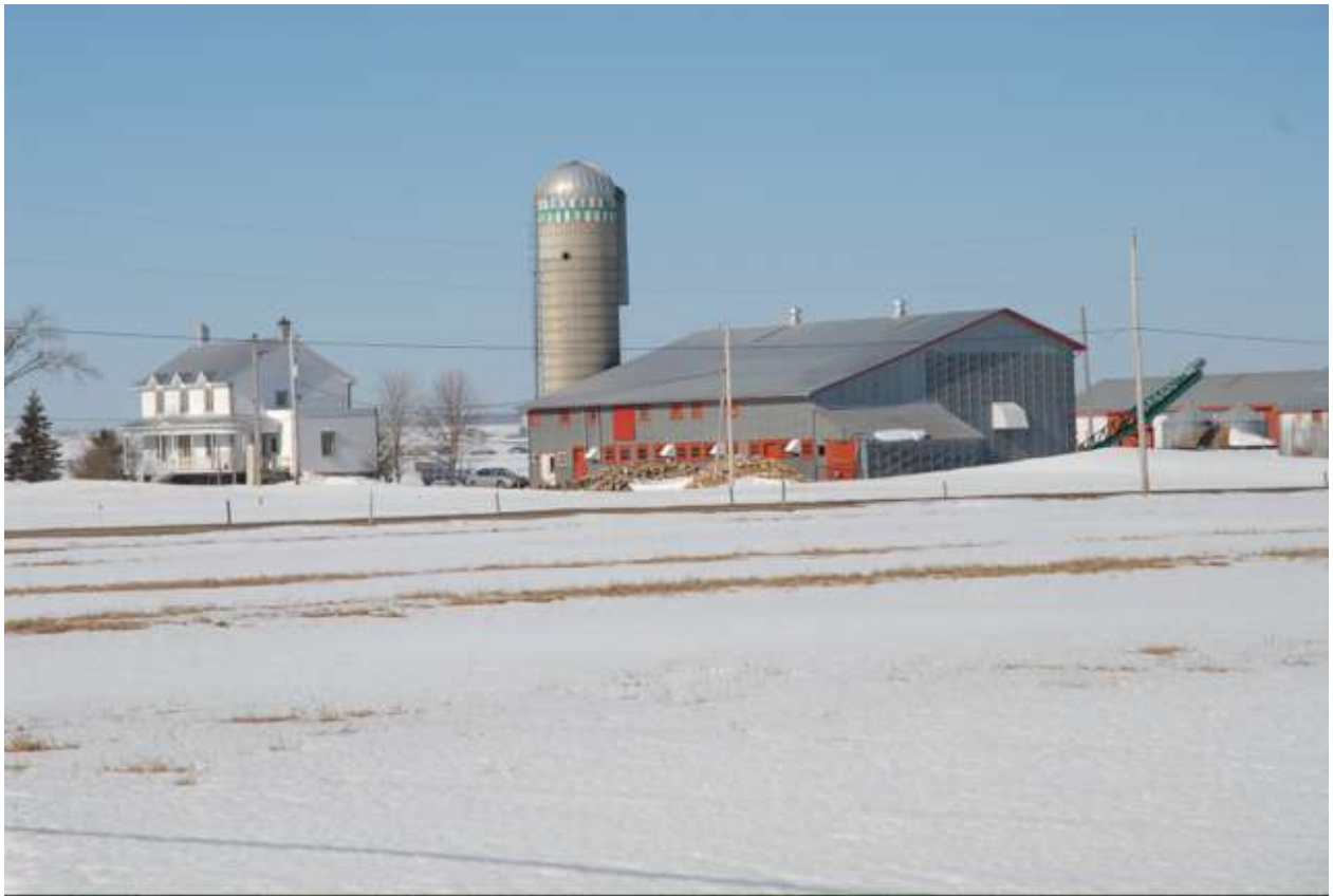
701, chemin d'Azur. Lot 548 du chemin du Village à La Durantaye. Voir carte, plus bas.

Cette ferme, située au 701 chemin d'Azur dans la municipalité La Durantaye, se trouve sur le territoire de l'ancienne seigneurie Saint-Michel, à la frontière qui la séparait de l'ancienne seigneurie Saint-Vallier, devenue municipalité en 1845. C'est du territoire de Saint-Vallier qu'elle a été photographiée. De façon inhabituelle, c'est la frontière de la seigneurie et non la frontière de la paroisse qui sert ici à délimiter le territoire municipal. Partout ailleurs, le territoire municipal était calqué sur le territoire paroissial.