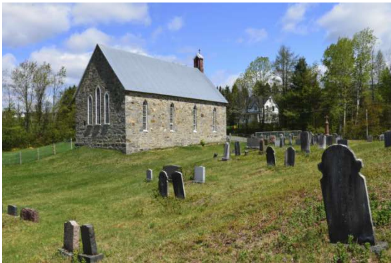
St-Paul's Church de St-Malachie, son cimetière et, juste en face, la maison du pasteur.

Voici ce qu'on lit sur la carte de la brochure au numéro 2 : La première église St-Paul's à Saint-Malachie, élevée en 1839, a été remplacée en 1851 par le bâtiment actuel, qui a été consacré en 1876.