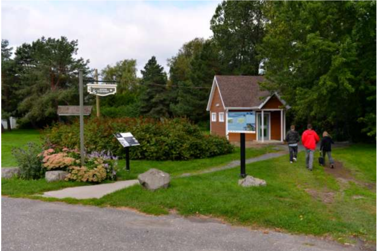
Halte routière de Saint-Vallier, à l'est de la rivière Boyer traversée par la route 132. Photo prise le 4 septembre 2013.

On a retrouvé les 4,5 arpents manquants du premier domaine seigneurial de la seigneurie de Saint-Vallier. L'omission de ce 4,5 arpents dans un bail à ferme intriguait certains chercheurs comme Yves Guillet. Selon des documents anciens, soit le terrier du Saint-Laurent de Marcel Trudel et l'aveu de dénombrement de Roland Tessier, nous savions que ce domaine seigneurial de Saint-Vallier mesurait 18 arpents de largeur au fleuve. Or un contrat de métairie signé le 27 juillet 1750 entre les Mères Hospitalières et Étienne Vallée, fermier engagé pour exploiter la terre domaniale des religieuses, seigneur des lieux, faisait mention de 13,5 arpents pour l'ensemble du domaine à exploiter. Où étaient donc passés les 4,5 arpents manquants aux 18 arpents d'origine, se demandait-on?