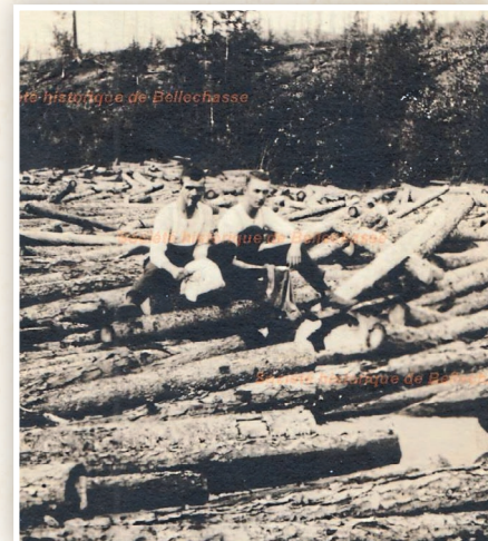
La formation d'embâcles était fréquente. Il fallait débayer la rivière des billots accumulés.

Au-delà des vestiges, la drave fait partie de l'identité québécoise. Elle rappelle une époque où l'homme travaillait en étroite relation avec la nature, dépendant du rythme des saisons et de la force des rivières.