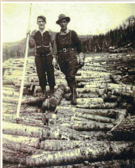
Draveurs bellechassois sur la rivière avec leur gaffe vers 1950. Source: Centre d'archives de Bellechasse. P008,S04,D001,B02.

Au XIX e siècle, le bois est au cœur de l'économie du Québec. Les vastes forêts de la rive sud alimentent un commerce en pleine expansion, notamment vers les marchés britanniques. Dans ce contexte, les rivières deviennent des axes logistiques naturels, et l'Etchemin ne fait pas exception, comme en témoignent les contrats de coupe de milliers de billots de pin et d'épinette à partir des années 1820 qui flotteront sur quelques affluents.