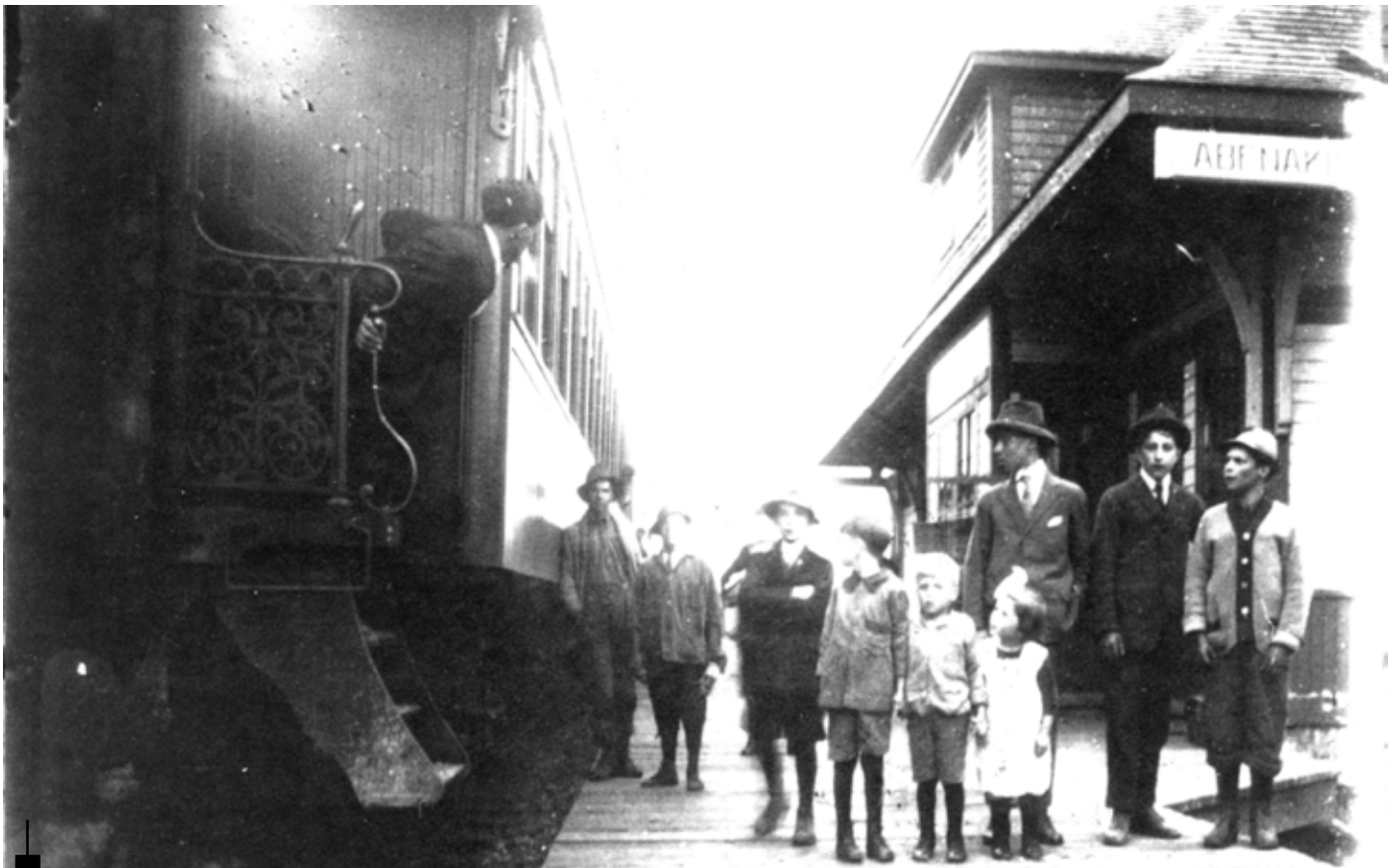
Gare des Abénakis vers 1930